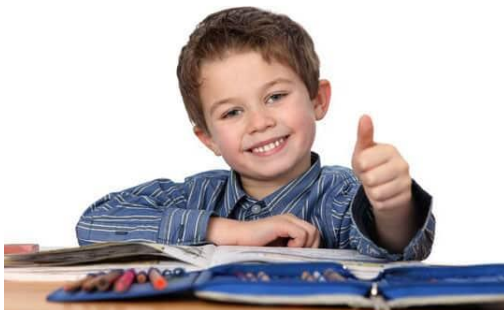
Freude und Zuversicht

Die Lehrerinnen und Lehrer habe ich in meiner ersten Wocheninformation mit diesem Bild begrüsst. Der Knabe strahlt für mich Freude und Zuversicht aus. Mein Wunsch an die Lehrpersonen wie auch an die Kinder der Schule Oberhofen-Lengwil ist, dass immer wieder diese Freude und Zuversicht in den Begegnungen spürbar wird.